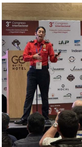
Fotografía 2. Capacitación en norma contra incendios