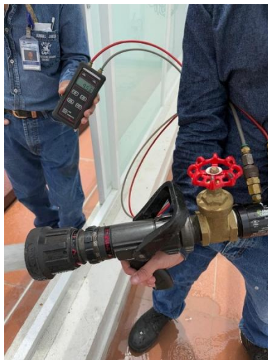
Fotografía 1. Ensayos hidráulicos