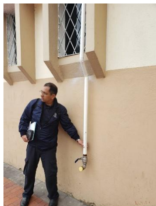
Fotografía 4. Inspección de sistemas de gases combustibles